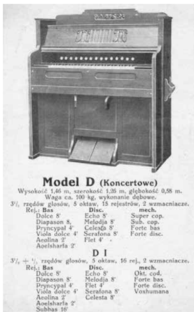
Ilustracja 3. Katalog fisharmonii M. Wybrański i S-ka z 1929 roku, modele D i DI

Następne modele w katalogu to fisharmonie Koncertowe . Dyspozycja modelu D to kompilacja dyspozycji głosów brząmiących modeli B i C. Inne są natomiast głosy mechaniczne. Typowe dla fisharmonii o rozbudowanej dyspozycji są łączniki oktawowe łączące w zakresie basowym o oktawę w dół i o oktawę w górę w dyszkancie. Registry Forte sterują klapami ekspresyjnymi identycznie jak w modelu B.