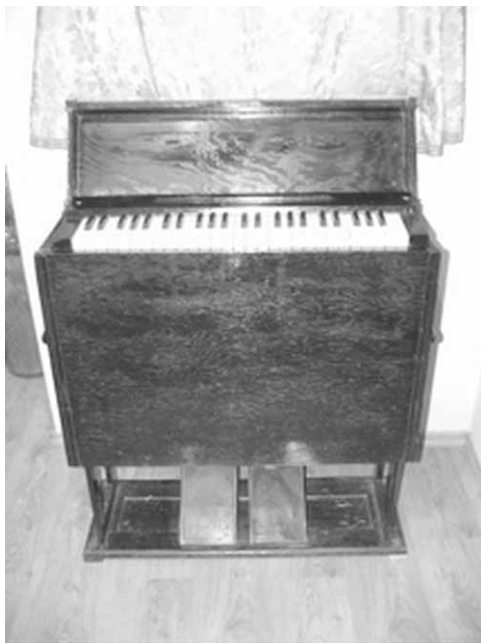
Ilustracja 6. Fisharmonia przenośna M. Wybrański i S-ka.

Instrument dzięki swojej konstrukcji był po złożeniu prostokątną skrzynią z dwoma uchwytami do przenoszenia. W takiej postaci mógł być bezpiecznie transportowany i używany np. podczas pogrzebów czy mszy polewowych. Tego typu fisharmonie były stosowane w armiach wielu krajów.