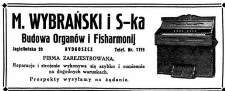
Ilustracja 1. Reklama zamieszczona w „Gazecie Handlowej” 1929 nr 286, s. 6