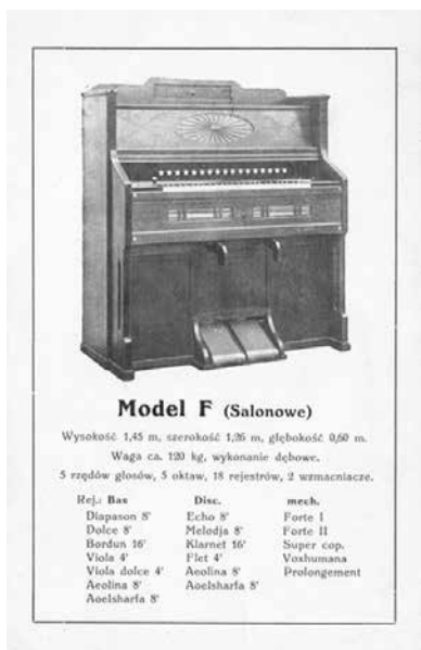
Ilustracja 4. Katalog fisharmonii M. Wybrański i S-ka z 1929 roku, model F

Zakres dyszkantowy został wzbogacony o nisko brzmiący głos Klarnet 16' . W miejsce głosu Serafona 8' i Celesta 8' wprowadzono kontynuację brzmieniową zakresu basowego, czyli Aeolinę 8' i Aeolsharfę 8' . W zestawie głosów mechanicznych pojawił się stosowany w fisharmoniach najwyższej klasy głos Prolongement , czyli przedłużacz. Głos ten standardowo był stosowany do najniższej oktawy ( F_1 -F) lub w zakresie C-c. Klucz rejestrowy włączający głos 51 umieszczany był na lewej przysadce klawiaturowej. Po włączeniu naciśnięty klawisz (lub kilka klawiszy) pozostawał w tym położeniu do czasu naciśnięcia innego klawisza. Tego rodzaju głos mechaniczny był też określany mianem substytutu pedału.