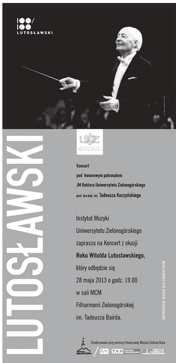
Ilustracja 4. Afisz zapowiadający koncert 28 V 2013 roku