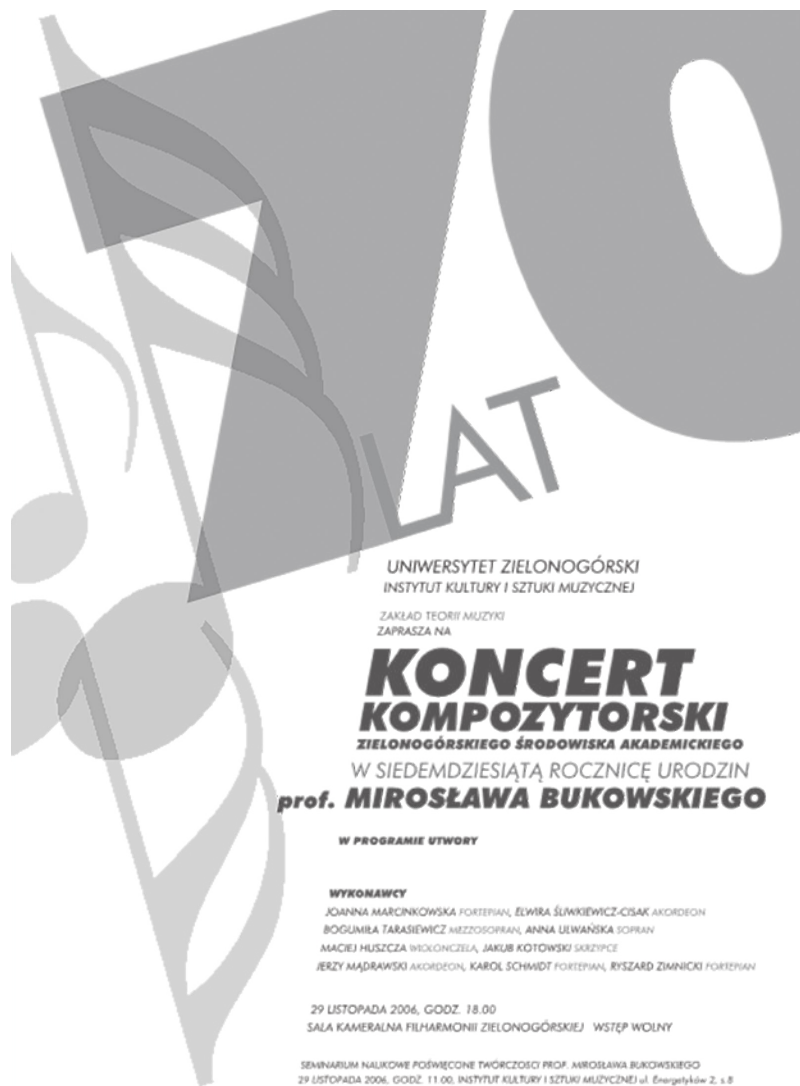
Ilustracja 1. Afisz zapowiadający koncert i seminarium naukowe 29 XI 2006