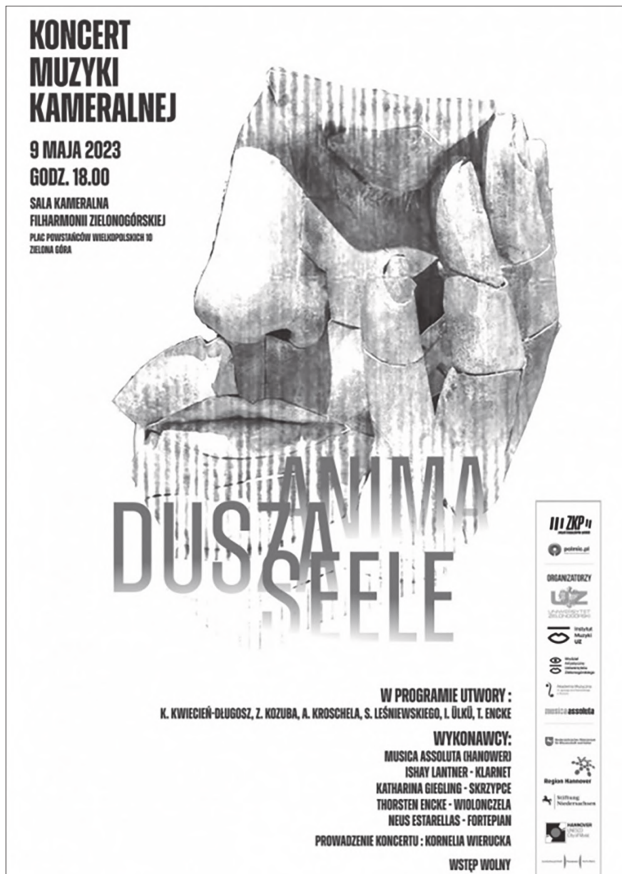
Ilustracja 10. Afisz zapowiadający koncert Dusza – Anima – Seele , 9 V 2023