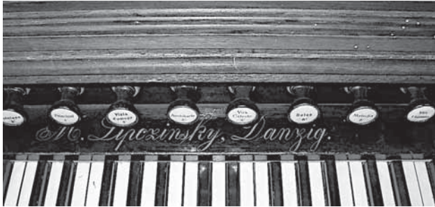
Ilustracja 7. Fragment stołu klawiaturowego fisharmonii Max Lipczinsky, Gdańsk, ok. 1910