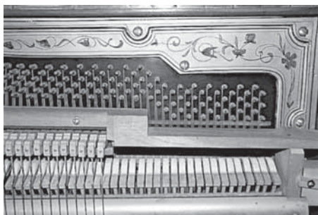
Ilustracja 2. Fragment mechanizmu górnotłumikowego i polichromowanej ramy żeliwnej pianina firmy J. Lipczinsky, Lębork (Lauenburg), ok. 1880–1890

skąpe informacje. Oprócz handlu chordofonami klawiszowymi wytwarzano tam również własne fabrykaty, w niewielkich raczej ilościach. Zachowane w bardzo dobrym stanie pianino sygnowane J. Lipczinsky / Lauenburg i. Pom. [in Pommern], które można datować na koniec XIX wieku, jest instrumentem górnotłumikowym z dwoma pedałami, strojnicą nieopancerzoną oraz siedmiooktawową klawiaturą ( A_2 - a^4 ) wykładaną kością słoniową. To typowe cechy konstrukcyjne instrumentów tego okresu, choć w tym czasie znano już mechanizm dolnotłumikowy i opancerzenie strojnicy. Wystrój zewnętrzny pianina zwraca uwagę ładnym usłojeniem orzechowej okleiny obudowy, trzema ozdobnymi płycinami w drzwiach górnych, a także pilastrami bocznymi w postaci kanelowanych kolumnienek. Również podpory stołu klawiaturowego zawierają ornamenty snycerskie, natomiast rama żeliwna ozdobiona została polichromią o płynnych motywach roślinnych typowych dla stylu secesji 10 (zob. ilustracja 2).