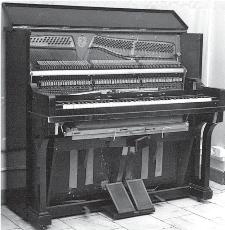
Ilustracja 8. Pianino-Harmonium Max Lipczinsky, ok. 1915, widok wnętrza instrumentu