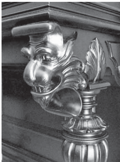
Ilustracja 4. Ozdobiona snycerką podpora stołu klawiaturowego pianina Max Lipczinsky, Gdańsk, ok. 1900