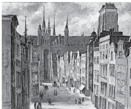
Ilustracja 10. Albert Lipczinski, Widok centrum starego Gdańska, ok. 1935, olej na płótnie; Muzeum Narodowe w Gdańsku